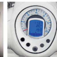
Tableau de bord "revival"