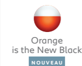
Orange is the New Black