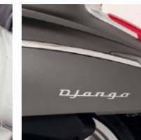
Joncs de carrosserie chromés